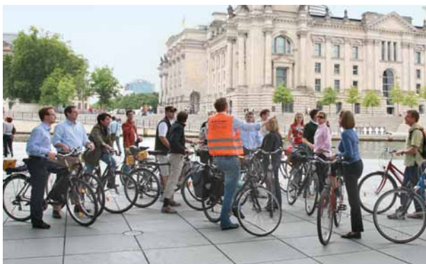
Alumni erkunden Berlin im Rahmen des zwanzigjährigen Jubiläums von In Praxi

In Praxi e.V., die Vereinigung der WHU-Absolventen, wurde bereits vom ersten Abschlussjahrgang gegründet. Der hohe Organisationsgrad von ca. 90 % spiegelt den ungewöhnlich starken Zusammenhalt von WHUlern wider. In der Satzung hat sich der Verein zur Unterstützung der WHU und ihrer Absolventen verpflichtet.