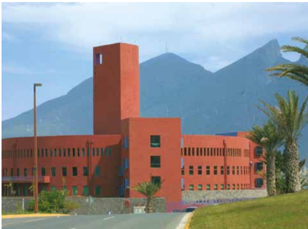
ITESM Instituto Tecnológico de Estudios Superiores de Monterrey, Mexiko

Mein Auslandssemester hat mir extrem geholfen, das an der WHU Gelernte und Erfahrene in einem größeren Zusammenhang sehen zu können und gleichzeitig die amerikanische Denkweise kennenzulernen. Das Auslandssemester ist meiner Ansicht nach essenziell, um den sprichwörtlichen Blick über den Tellerrand auch kulturell zu realisieren.